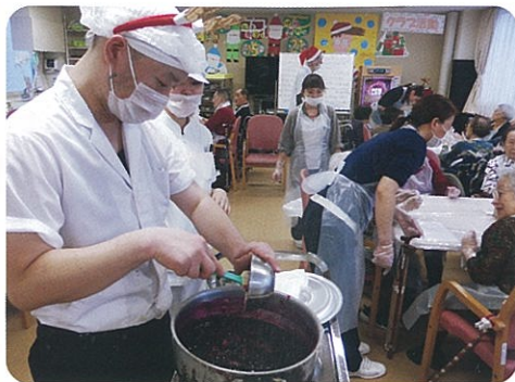
ソースづくりの鍋から漂うベリーの甘酸っぱい香り

毎年クリスマスシーズンの恒例行事となった、デイケアのおやつレクでのケーキづくり。昨年は12月19日(月)に、31名のご利用者さまがケーキづくりを楽しみました。まず最初にソースの材料となるベリーを握りつぶしてもらい、煮詰めている間に泡立て器でホイップづくり。続いて絞り器を使ってクリームのデコレーションをし、お菓子やいちごのサンタなどを飾つ