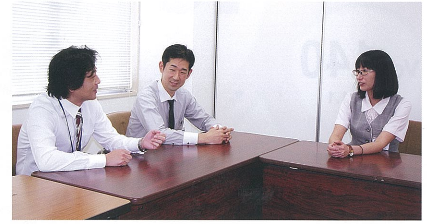
プロジェクトの事務局を務める3人は、日本医療機能評価機構認定のクオリティマネジャー

優れた病院を判断する指標のひとつに、公益財団法人日本医療機能評価機構による認定があります。これは中立的科学的立場の第三者機関が医療機関の機能を審査する制度で、当院は2013年に定水準を満たしている病院として認定を受けました。認定は5年ごとに更新が必要で、当院は2018年2月に再び受審を予定しています。