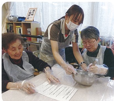
意外と力が要る生クリームの泡立て

て完成です。ホイップは8割方泡立てておくなど下準備をしておき、皆さんには自身の手でつくることを目指していただきました。生クリームの塗り方やお菓子の配置など、デコレーションに作り手の