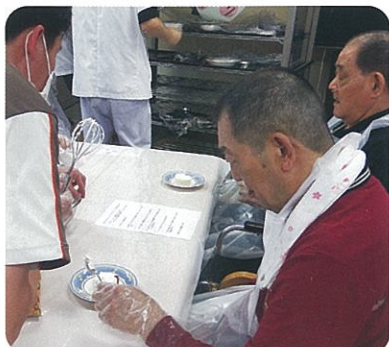
クリームを塗るとクリスマスケーキらしく変身