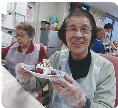
完成作品を手ににっこり