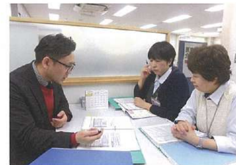
事業所スタッフでミーティング中

合格者には、87時間以上の実務研修後に資格が付与されます。現在、この試験は難易度が上がっており、北海道では平成30年度は合格率9・1%の難関となりました。上位資格に主任介護支援専門員（主任ケアマネ）があります。効率的な業務管理や人材育成を推進する観点から、2021年4月