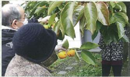
デイケアのご利用者さまも収穫作業に参加。以前は、当時の所有者の許可を得て、デイケアのレクや入院患者さまの屋外散歩で柿採りを体験

当院と同じ区画に柿の木があるのをこ存じでしょうか。長年北海信用金庫豊平支店だった建物の脇にある、ひときわ枝ぶりのよい樹木がそれです。