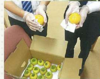
少し青いくらいが採りごろ。へた部分をアルコールで湿らせ密封して抜抜き

この土地・建物は昨春に当院所有となり、現在は公用車専用駐車場として使っています。不動産とともに柿の木のオーナーにもなった当院に、町内からお問い合わせやご助言が届き、実はこの柿の木が大変貴重なものであるということがわかりました。