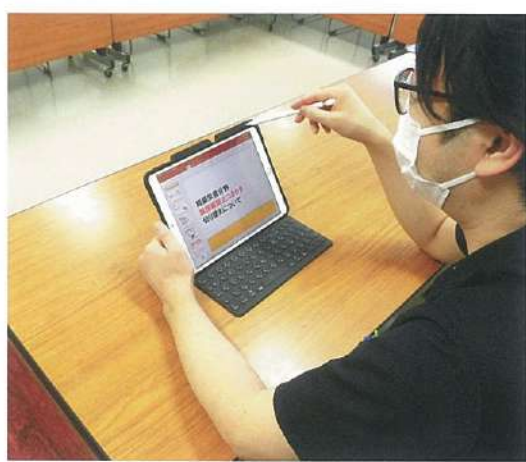
研修動画に使うデータを確認中

閲覧できるようにしました。また、動画で使った資料を紙に出力し、レジユメも用意。インターネット環境やIT知識に個人差があっても、職員全員がオンライン研修に参加できるように配慮しました。